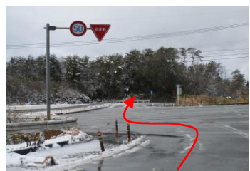
マラソンコース入口 旅行村まで3km

・山陽道・西条IC～国道375号線～豊栄宮の首交差点左折～世羅方面の看板が見えるまで進み～世羅が見えたら大きく右折、進むと旅行村方面の看板あり。（約40分）